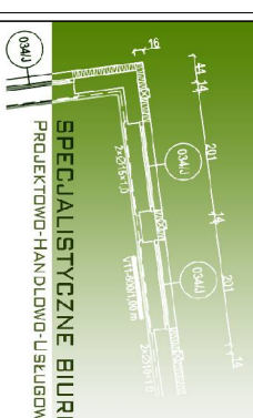
SPECJALISTYCZNE BIURO PROJEKTOWO-HANDLOWO-USLUGOWE